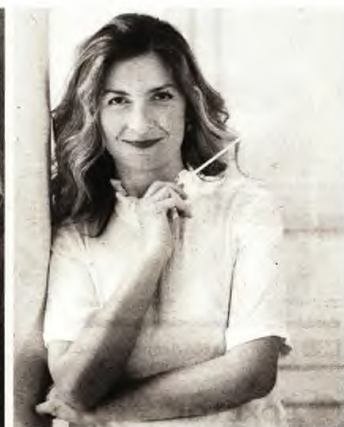
Ο περιζήτητος τενόρος έρχεται στη Θεσσαλονίκη στο πλαίσιο του Φεστιβάλ Επταπυργίου για να συμπράξει με την ΚΟΘ υπό τη διεύθυνση της επικεφαλής της Ζωής Τσόκανου.

Ένας από τους κορυφαίους τενόρους της γενιάς του και ένας από τους διασημότερους παγκοσμίως, ο Μεξικανός Ραμόν Βάργκας έρχεται στη Θεσσαλονίκη στο πλαίσιο του Φεστιβάλ Επταπυργίου για να συμπράξει με την Κρατική Ορχήστρα Θεσσαλονίκης υπό τη διεύθυνση της επικεφαλής της Ζωής Τσόκανου σε ένα γκαλά όπερας που περιλαμβάνει μερικές από τις πλέον δημοφιλείς άριες του λυρικού ρεπερτορίου.